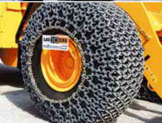
▣ Kettensystem am Hyundai HL980-Großradlader auf der BAUMA 2016

Inbetriebnahme. Die richtige Dimensionierung der Ketten in Bezug auf Einsatzfall, Maschinengröße und zu bewegendem Material ist der entscheidende Faktor für den erfolgreichen Einsatz von Reifenschutzketten auf Radladern. Hierbei können wir auf jahrzehntelange Erfahrungen mit Reifenschutzketten in unseren Betrieben zurückgreifen.