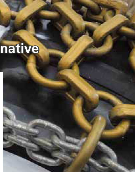
▣ Unterschiedliche Kettenstrukturen für Hartsteingewinnung und bindige Böden.

Von unseren drei Standorten innerhalb Deutschlands gewährleisten unsere Techniker den kompletten Service rund um Ihre Reifenschutzketten. Von der Montage, über das Spannen und Kürzen der Ketten bis zum Ersatzteilsupport erhalten Sie von uns alles aus einer Hand. Oberste Prämisse hierbei ist es die Verfügbarkeit der Maschine zu erhöhen und gleichzeitig die Betriebskosten zu senken“. Auf der Bauma 2016 waren die Ketten unter anderem auf dem brandneuen Hyundai-Radlader HL980 (5,5-m 3 -Klasse) zu bewundern.